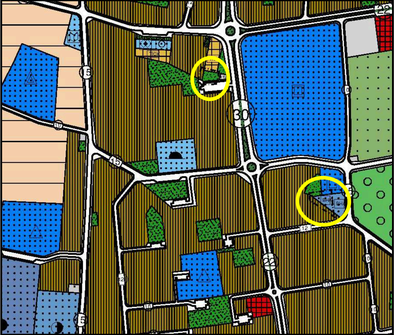
Tablo1: Arazi Kullanım Kararları Değişimi