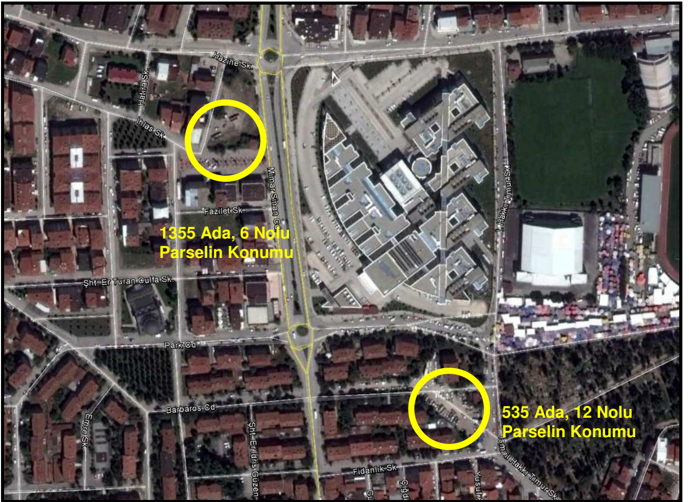
Şekil 1: Plan Değişikliğine Konu Alanların Konumu

Bursa İli, İnegöl İlçesi, Burhaniye Mahallesi; 535 Ada 12 Parsel Barbaros Caddesinin güneyinde, 1355 Ada 6 Nolu Parsel de Mimar Sinan Caddesinin yaklaşık 25 metre batısında konumlanmıştır.